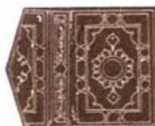
پایه نخستین مان‌گشت‌نایب‌نفت